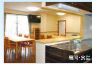
(写真はグループ他施設の居室と居間・食堂)