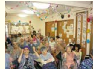
お誕生日パーティー