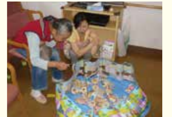
ハロウィンパーティ