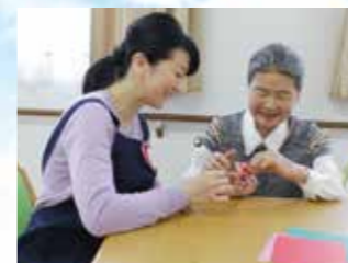
イメージ写真です