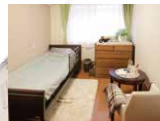
グループ他施設の居室