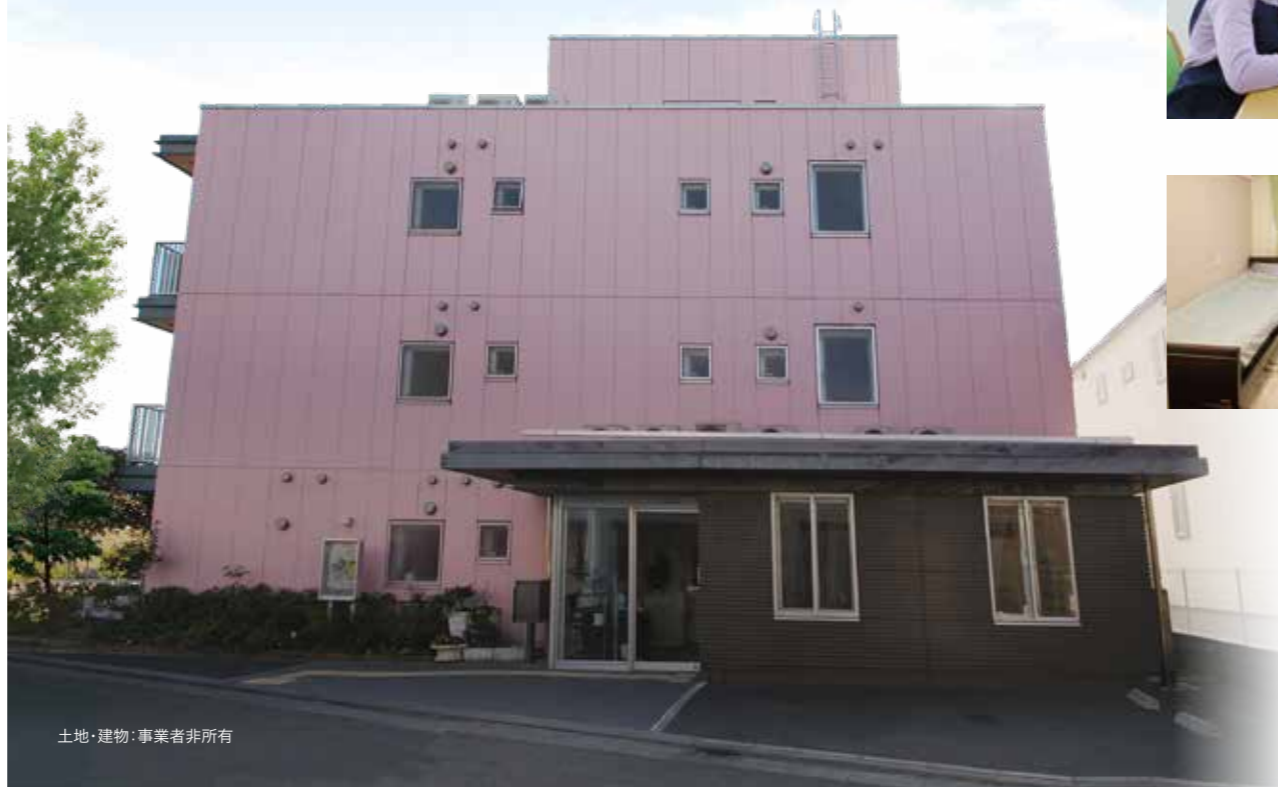
土地・建物：事業者非所有