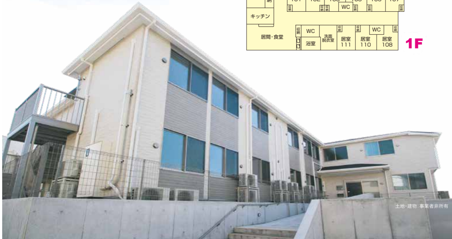
土地・建物：事業者非所有