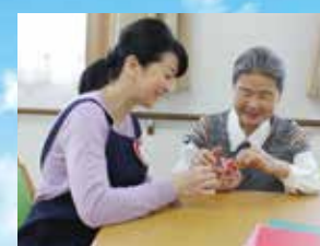
(写真はイメージ写真です)