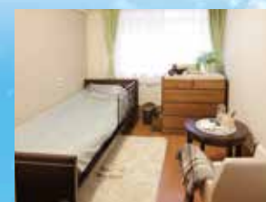
(写真はグループ他施設の居室)