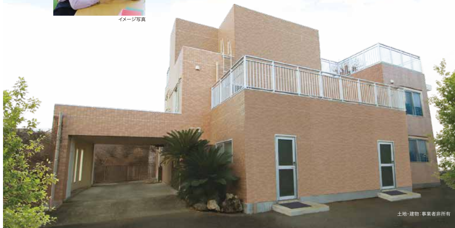
土地・建物：事業者非所有