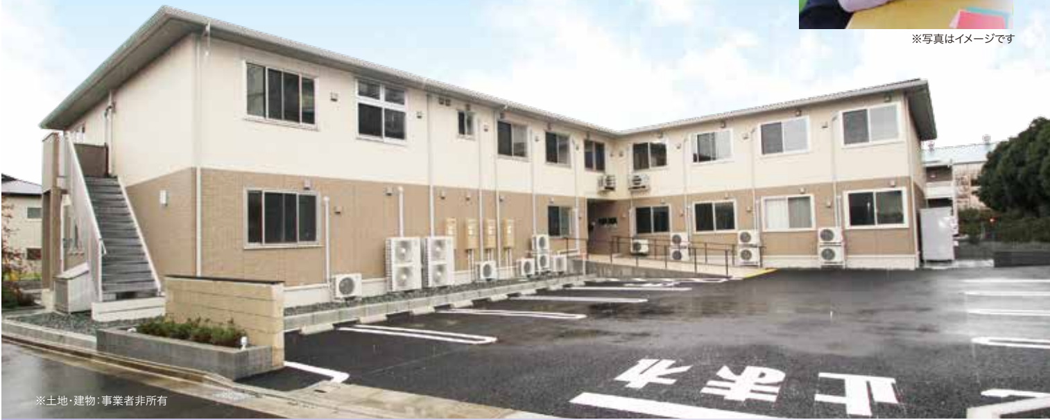
※土地・建物・事業者非所有