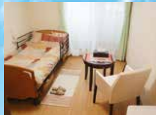
※写真はグループ他施設の居室