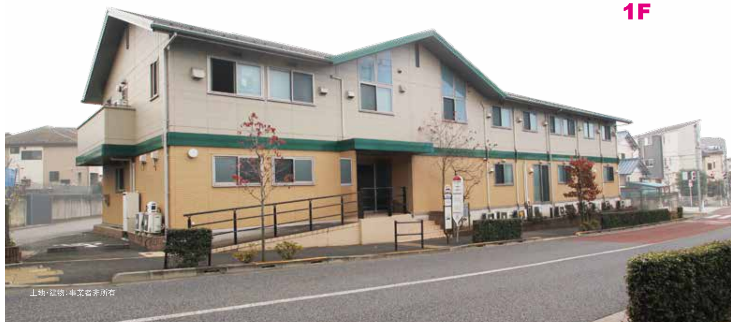
土地・建物・事業者非所有