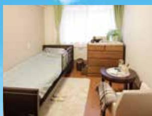
グループ他施設の居室