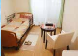
※写真はグループ他施設の設備