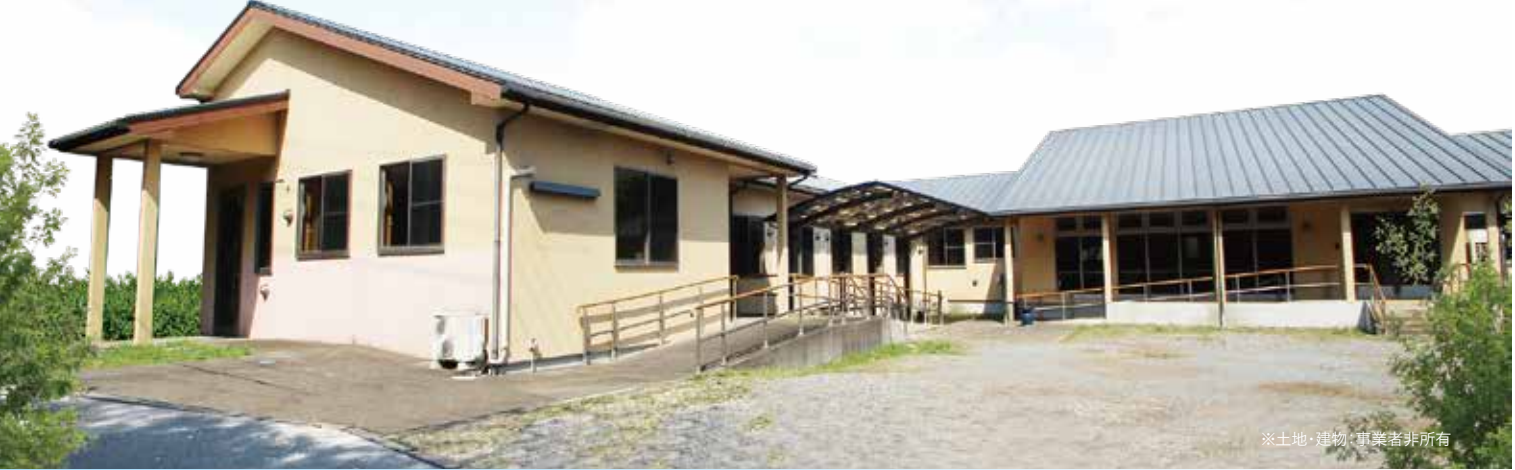
※土地・建物・事業等非所有