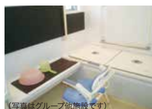
(写真はグループ他施設です)