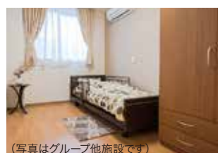
(写真はグループ他施設です)