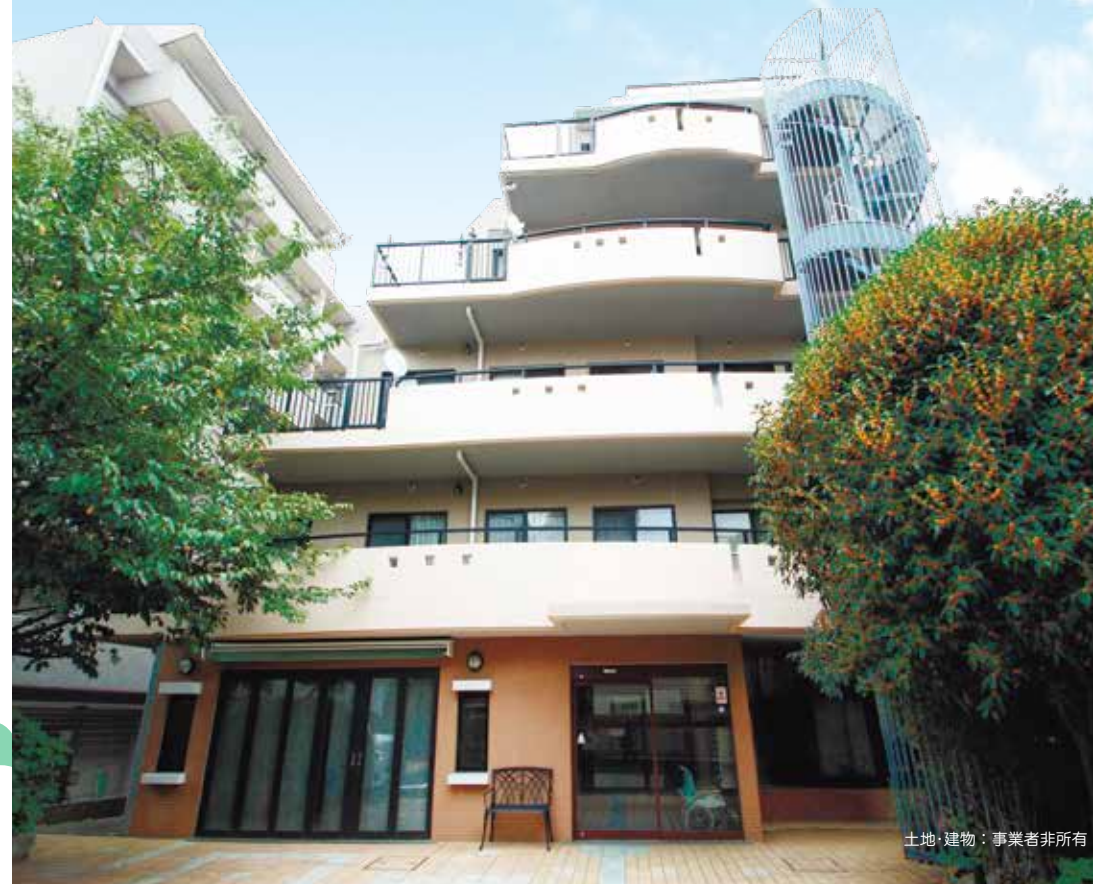
土地・建物：事業者非所有