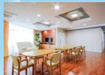
グループ他施設の居間・食堂