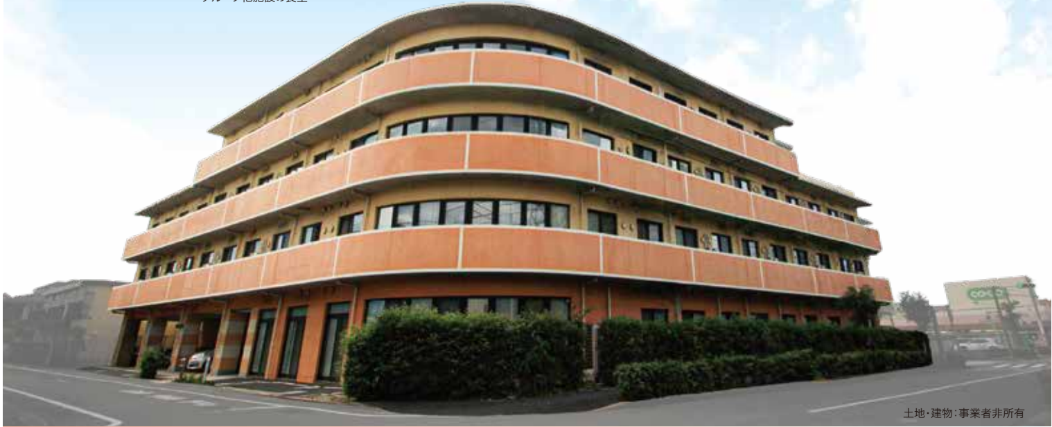
土地・建物：事業者非所有