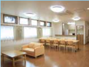
グループ他施設の食堂