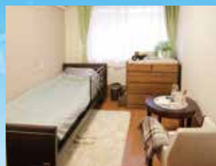
グループ他施設の居室