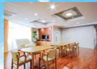
グループ他施設の居間・食堂