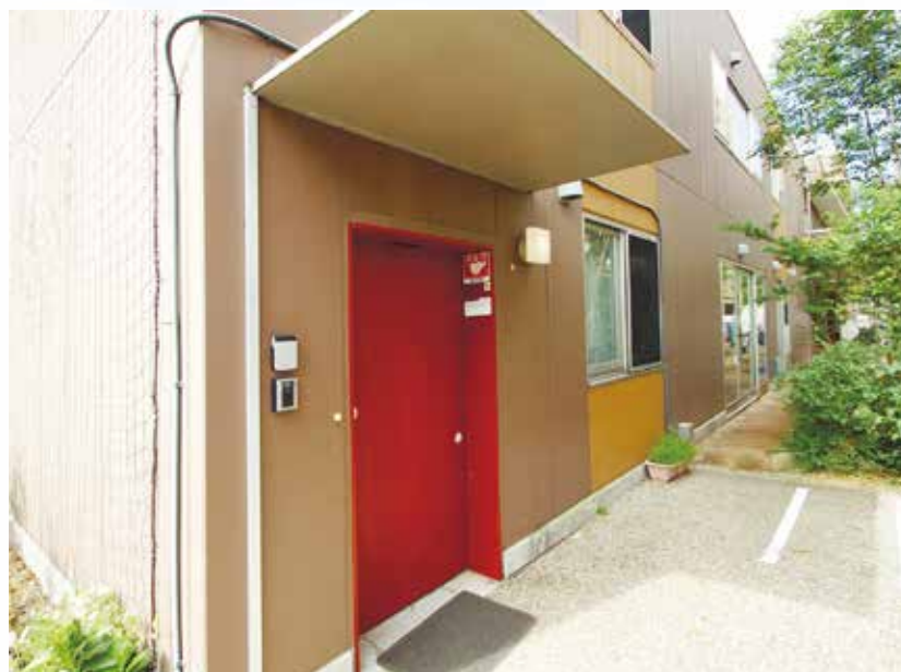
土地：事業者非所有、建物：事業者所有