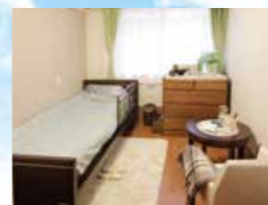
グループ他施設の居室