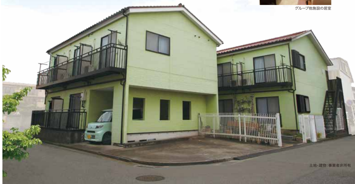
土地・建物・事業者非所有