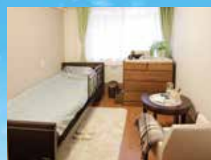
(写真はグループ他施設の居室)