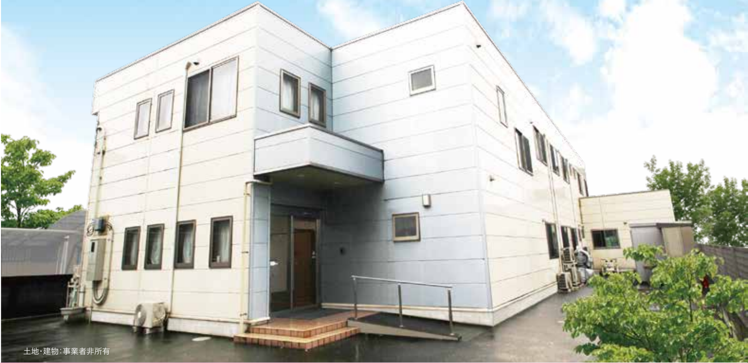
土地・建物・事業者非所有

入居様のプライベートを大切にしております。 お部屋では、読書や手芸、テレビ鑑賞など 各々自由にお過ごしいただけます。