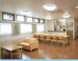
グループ他施設の食堂