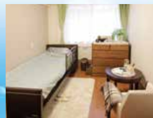
写真はグループ他施設の居室