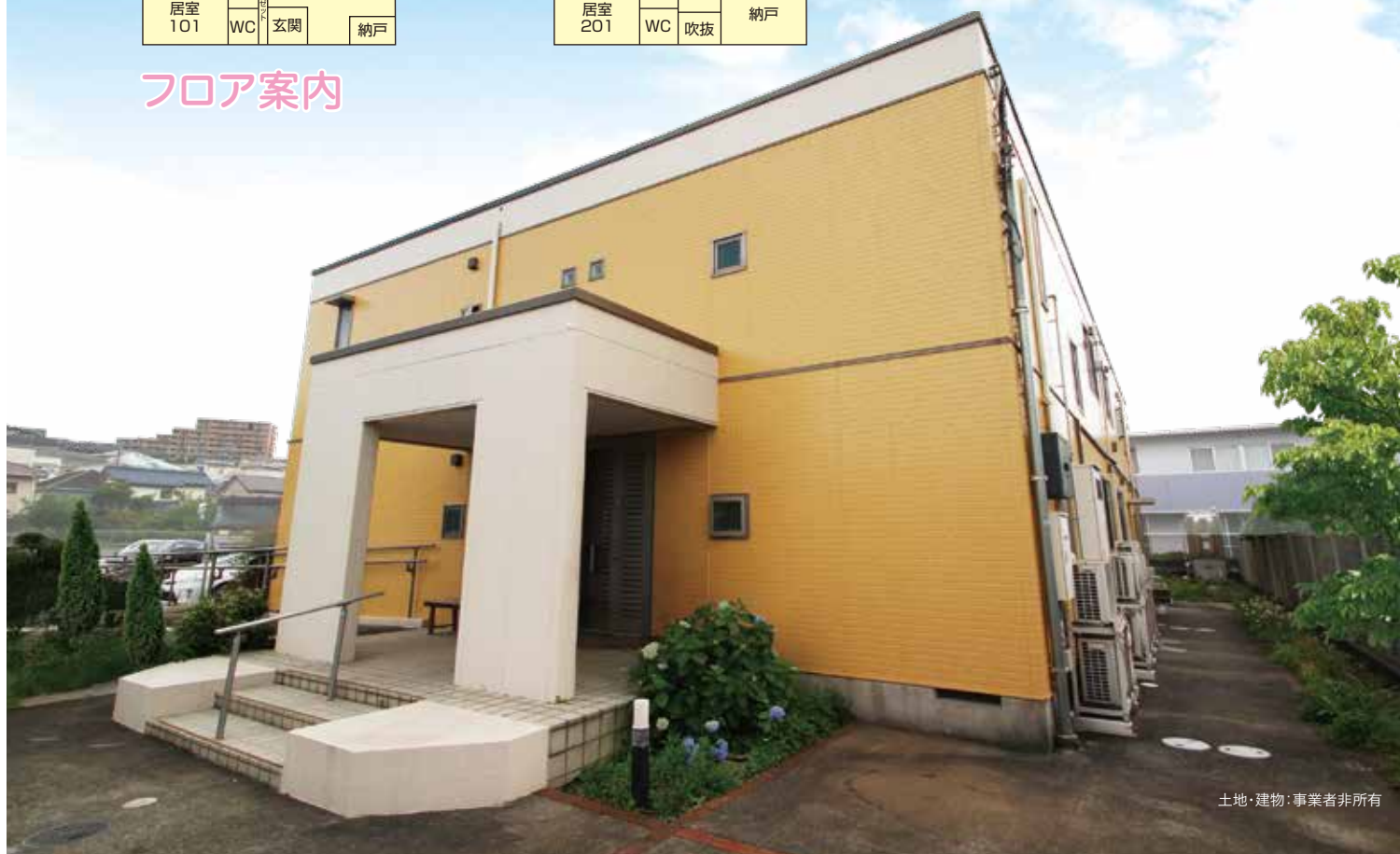
土地・建物・事業者非所有