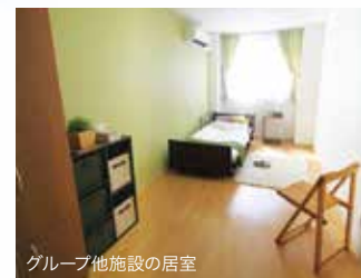
グループ他施設の居室