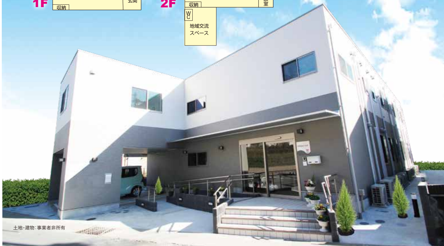
土地・建物：事業者非所有