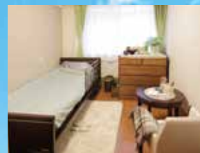
(写真はグループ他施設の居室)