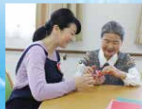
(写真はイメージ写真です)