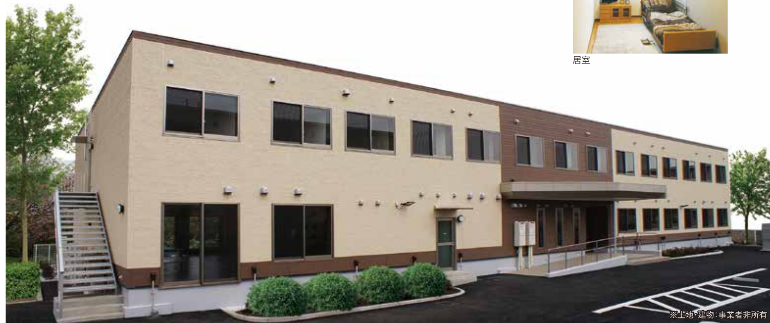
※土地・建物：事業者非所有

■類型/住宅型有料老人ホーム ■居住の権利形態/利用権方式 ■利用料の支払方式/月払い方式 ■入居時の要件/要介護 ■介護保険/介護保険在宅サービス利用可 ■居室区分/全室個室 ■土地建物の権利形態/通常借家契約30年 ■共用施設・設備/食堂兼機能訓練室、浴室、トイレ、洗面設備、健康管理室、他 ■敷地面積/972.78㎡ ■延床面積/999.03㎡ ■構造/鉄骨造2階建 ■定員/30名 ■居室総数/30室 ■居室面積/13.08~13.625㎡ ■開設年月/平成28年6月