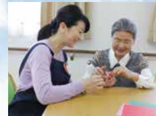
※写真はイメージ写真です