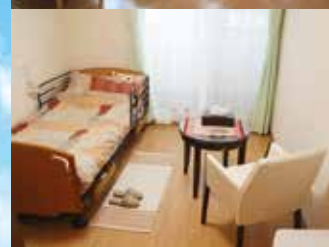
※写真はグループ他施設の設備