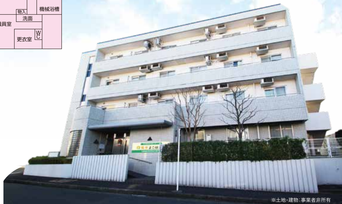
※土地・建物：事業者非所有