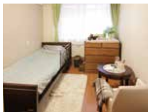
(写真はグループ他施設の居室)