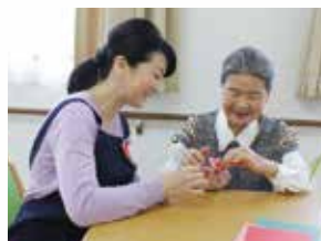
(写真はイメージ写真です)