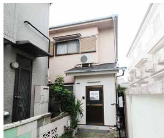
(土地・建物：事業者所有)