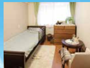
(写真はグループ他施設の居室)