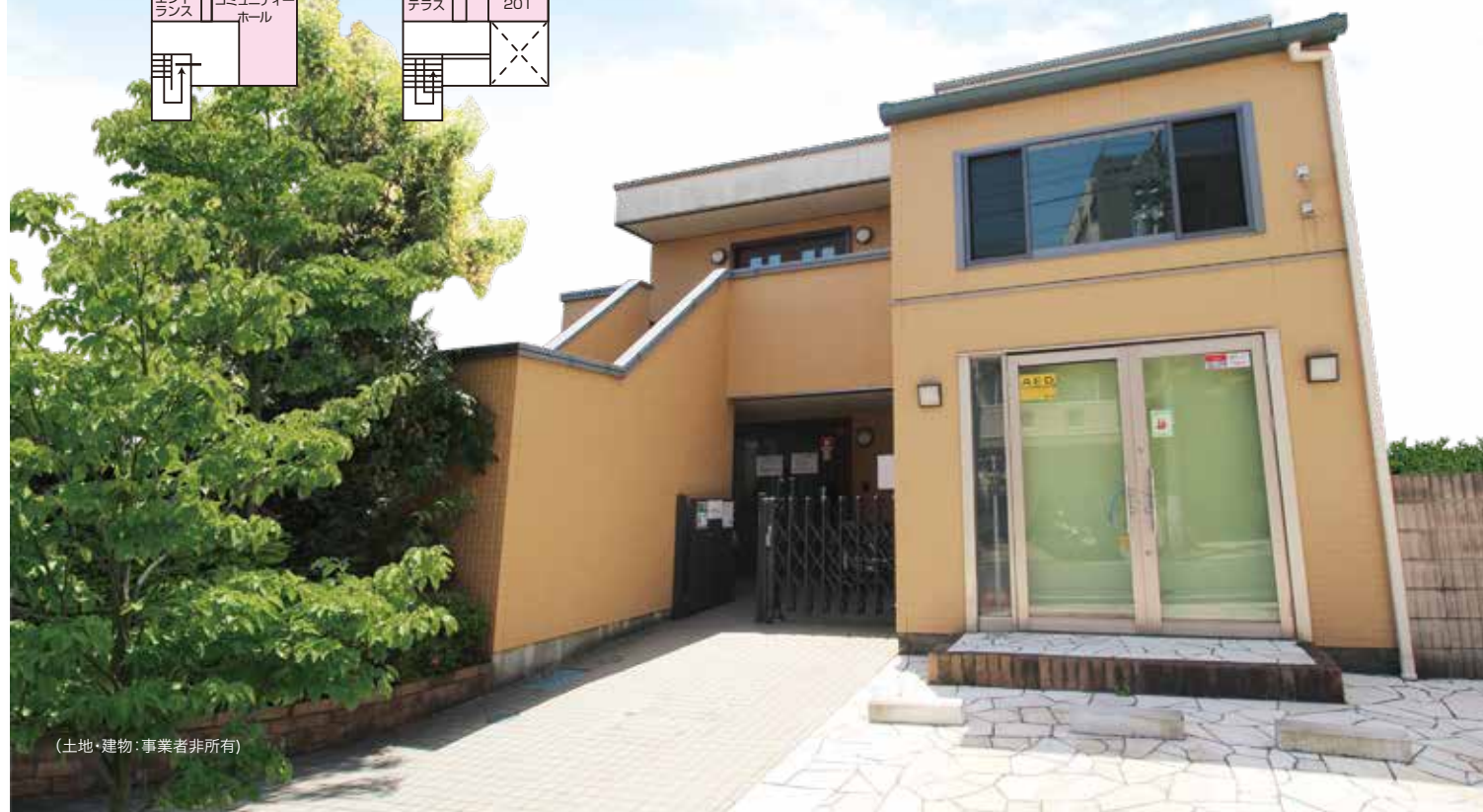
(土地・建物：事業者非所有)