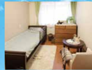
(写真はグループ他施設の居室)