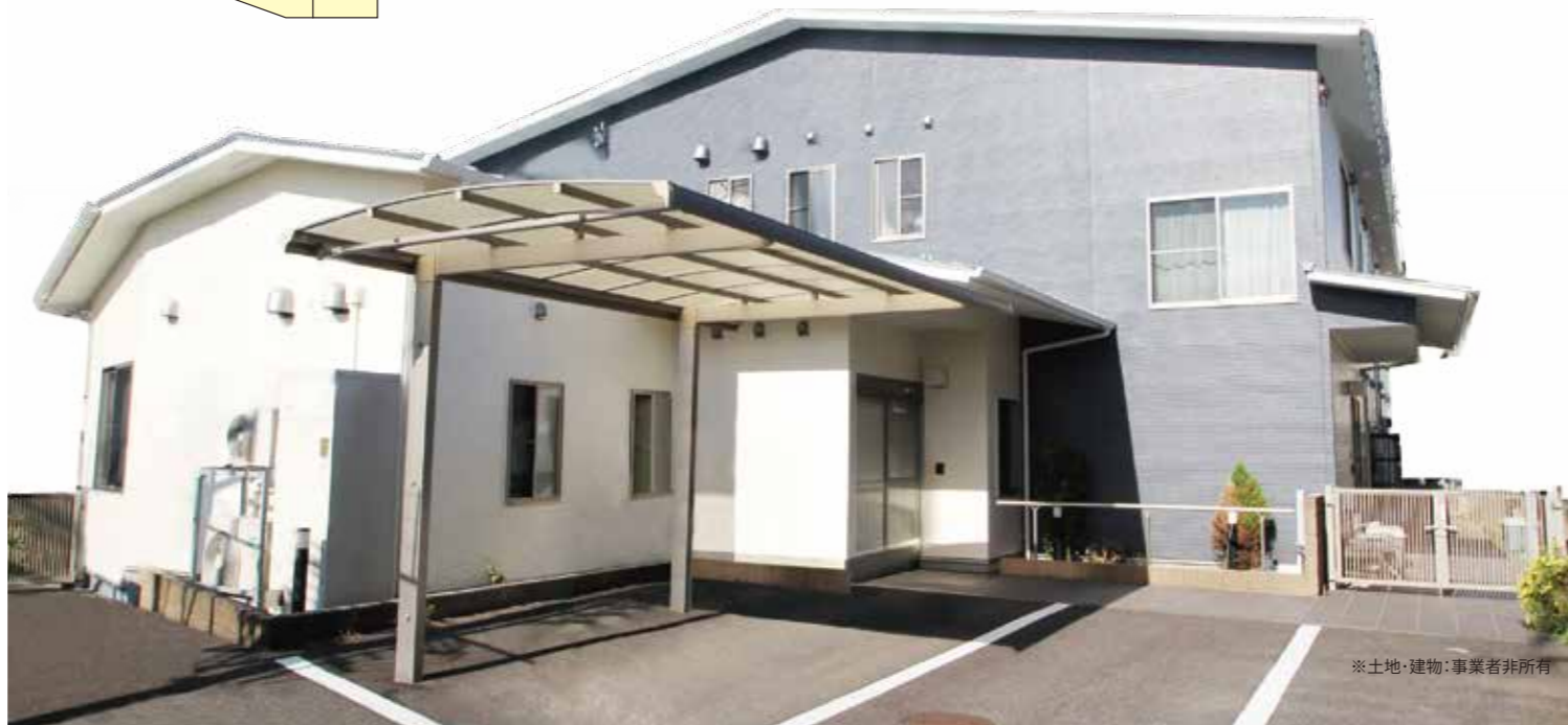
※土地・建物：事業者非所有