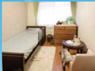
(写真はグループ他施設の居室)