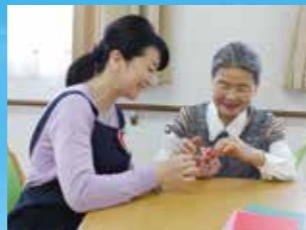
(写真はイメージ写真です)