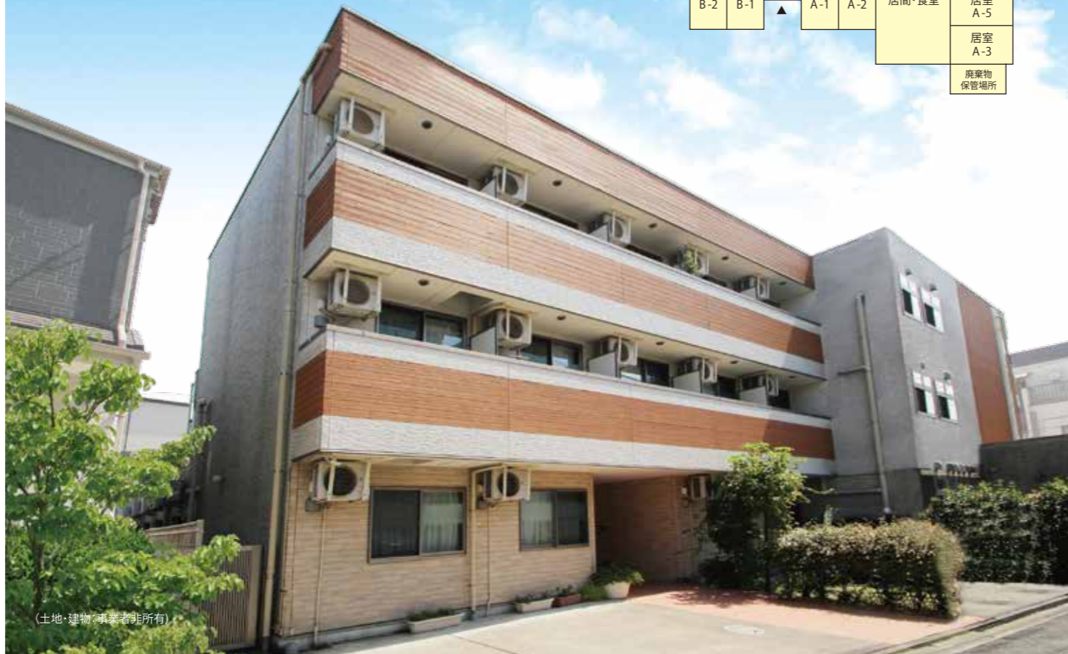
(土地・建物/事業者非所有)