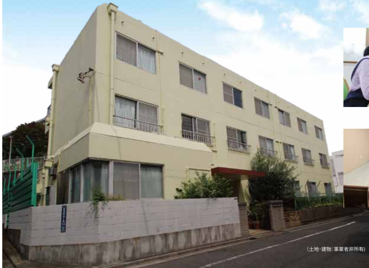
(土地・建物:事業者非所有)