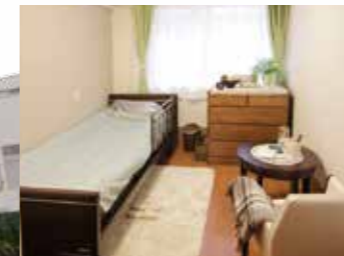
(写真はグループ他施設の居室)