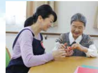
(写真はイメージ写真です)