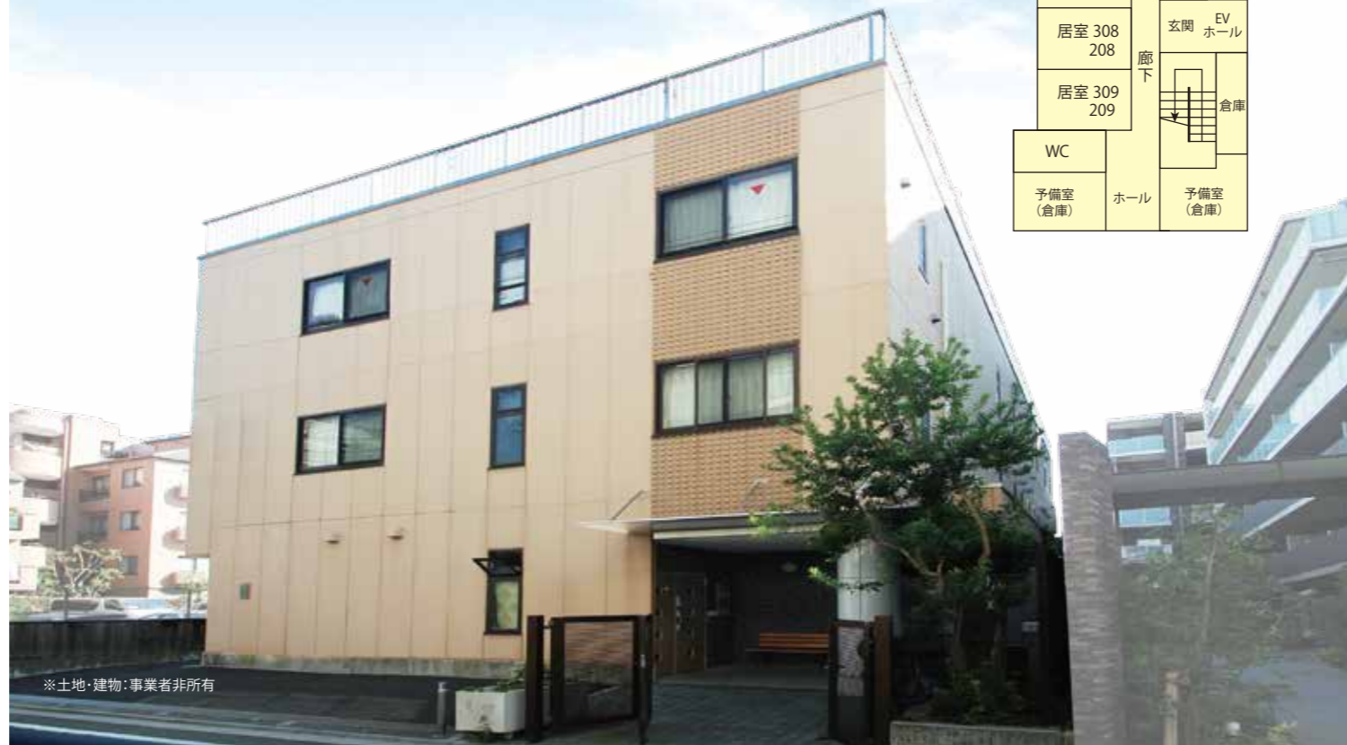
※土地・建物：事業者非所有