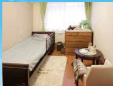
(写真はグループ他施設の居室)