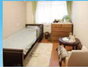
(写真はグループ他施設の居室)