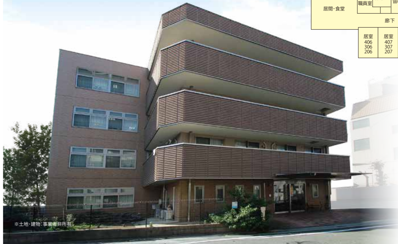
※土地・建物：事業者非所有