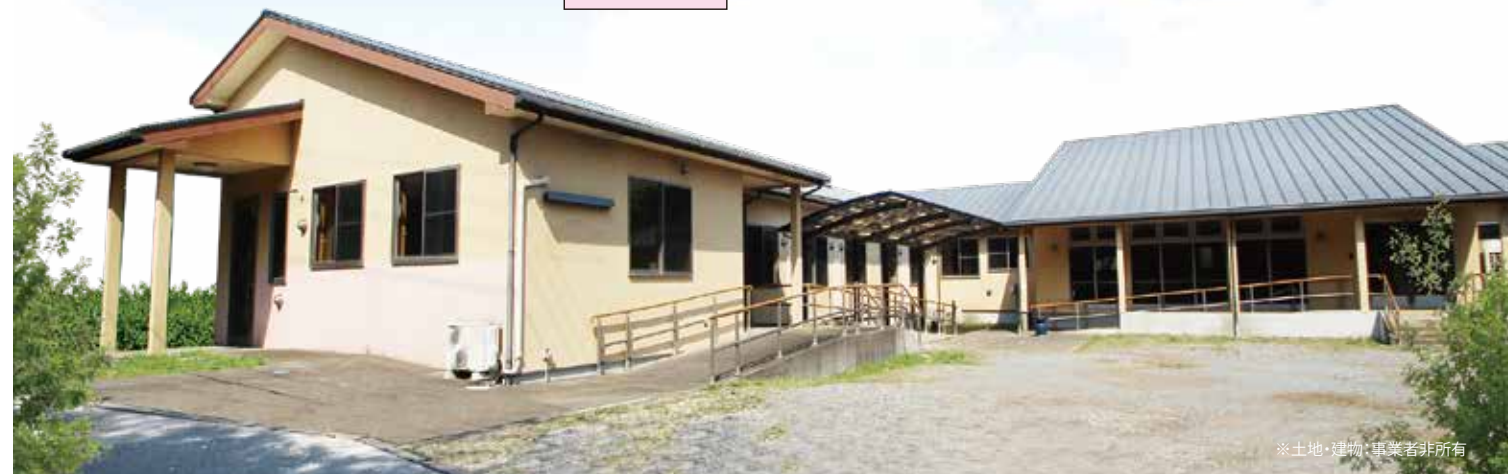
※土地・建物・車業者非所有

■類型/ショートステイ ■入居時の要件/要支援・要介護 ■土地建物の権利形態/普通建物賃貸借契約20年 ■共用施設・設備/食堂兼機能訓練室、浴室、トイレ、洗面設備、面談室、医務室、緊急コール他 ■敷地面積/2,691.74㎡ ■延床面積/842.99㎡ ■構造/木造1階建 ■宿泊室/20室 ■居室面積/10.68~12.27㎡ ■開設年月/2020年7月