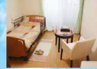
※写真はグループ他施設の設備