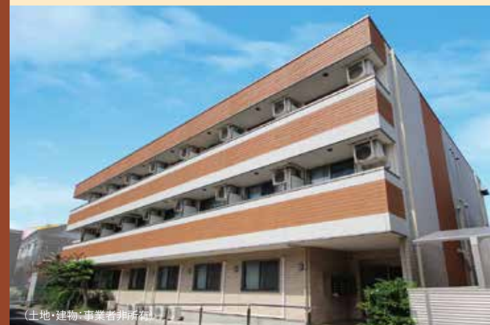
(土地・建物・事業者非所有)