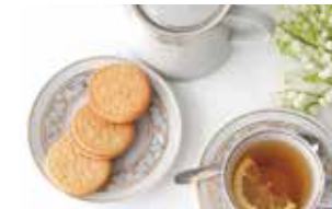
午前と午後にティータイム