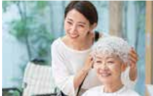
心身ともにリフレッシュ ※訪問医療マッサージ、訪問理美容は有料