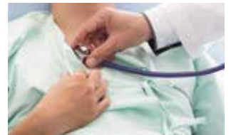
総合的で安心な診療をご提供