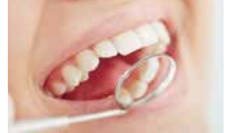
医療 / 介護保険にて対応