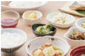
刻みやミキサーにも対応