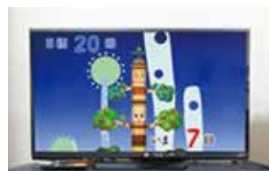
“起立運動”ゲームで筋力強化