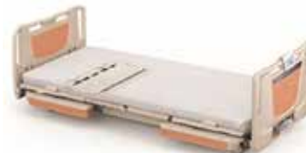
ベッドセンサーの見守り支援システム