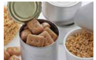
非常食を常備管理しています