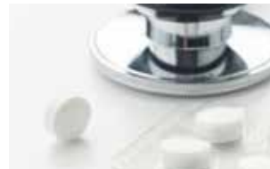
服薬の管理、記録まで行います