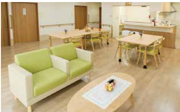
清潔感のある居間・食堂で、自由な時間をお過ごしいただけます

弊社専属部署による建物内外装の設計・整備・管理により快適で安心した暮らしを支えます。