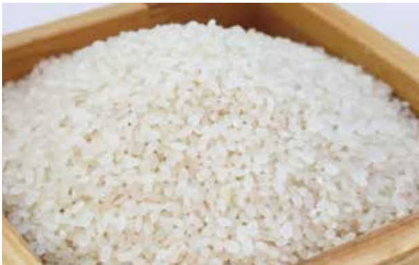
毎年11月にコシヒカリの単一原料米に切り替えています