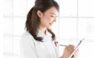
不測の事態時、迅速な医療サービス