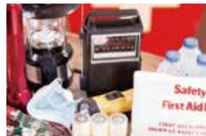
災害備品を常備管理しています