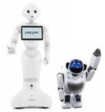
頼もしいコミュニケーションロボット