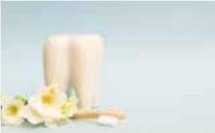
開口、滑舌、嚥下などをトレーニング