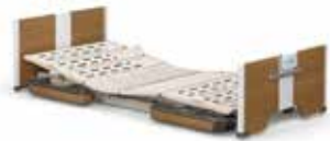
※福寿はレンタルになります 電動ベッドで快適に過ごせます