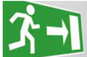
年2回の避難訓練(1回は夜間想定)

※BCP計画(事業継続計画):災害などの緊急事態が発生したときに、企業が被害を最小限に抑え事業の継続や復旧を図るための計画。