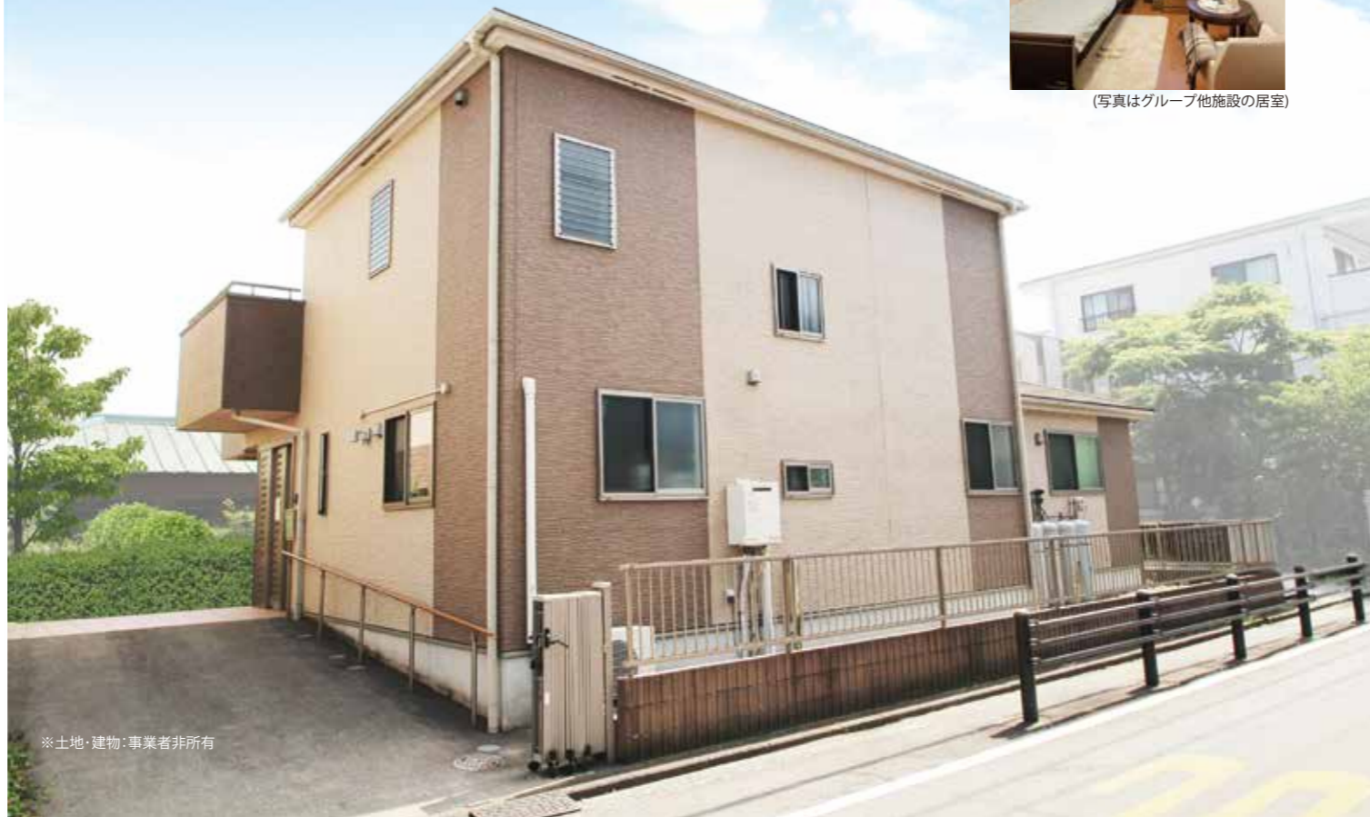
※土地・建物：事業者非所有