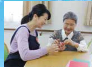
(写真はイメージ写真です)