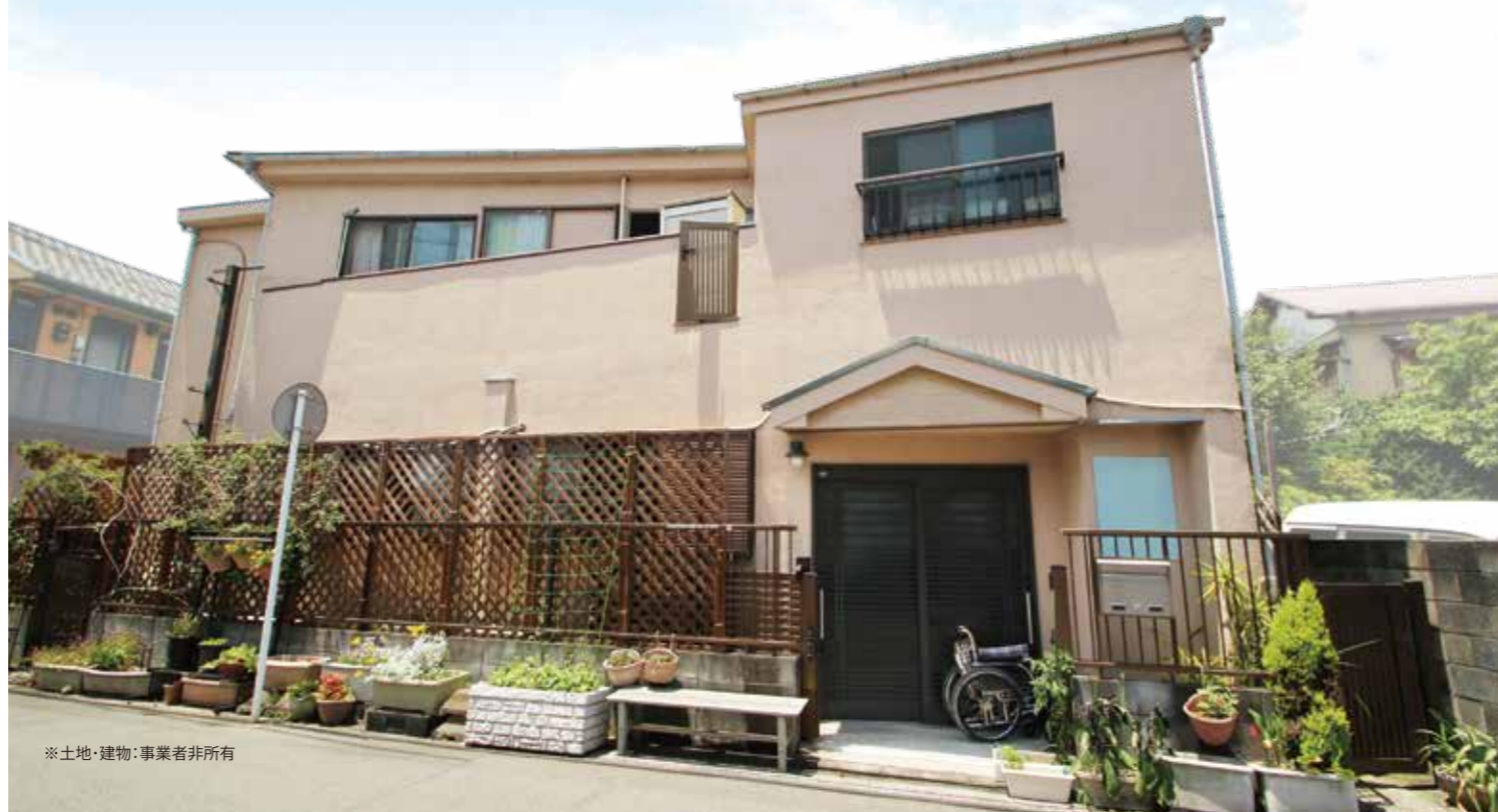
※土地・建物・事業者非所有