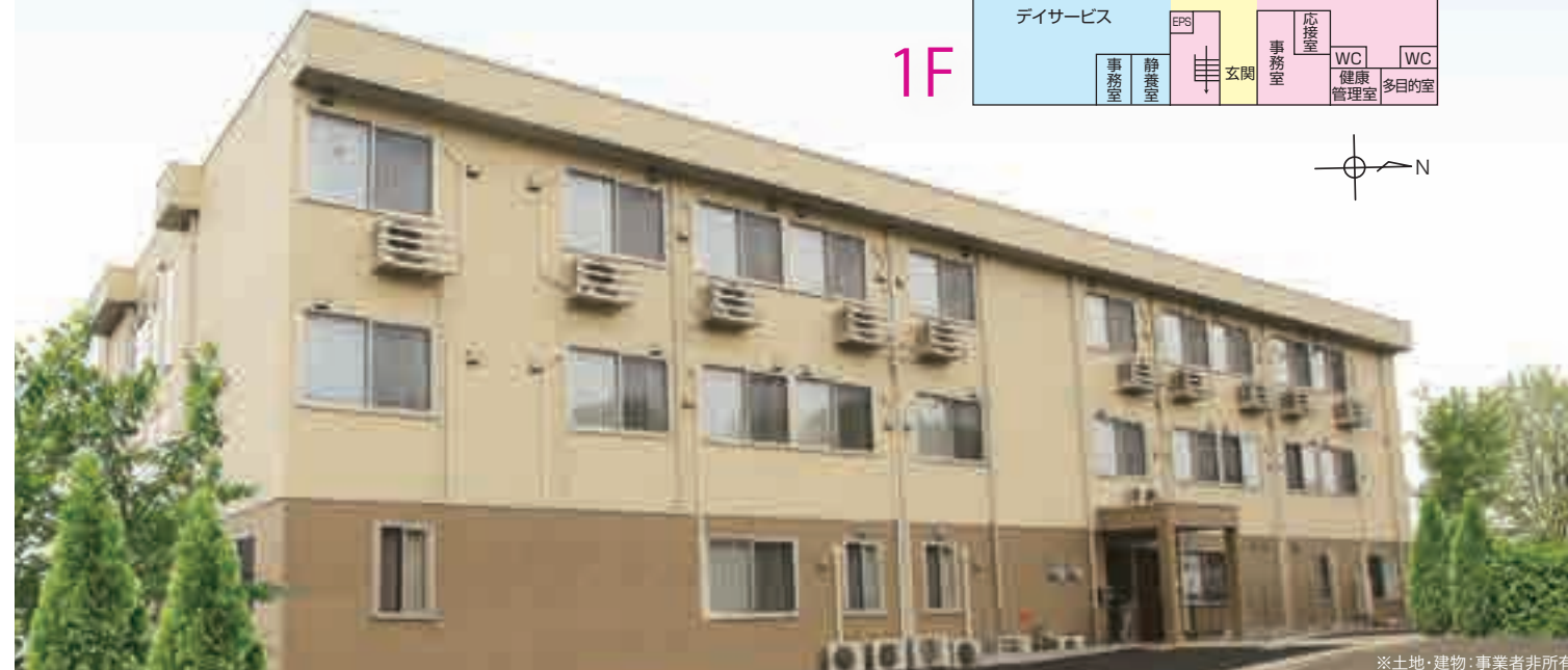
※土地・建物:事業者非所有