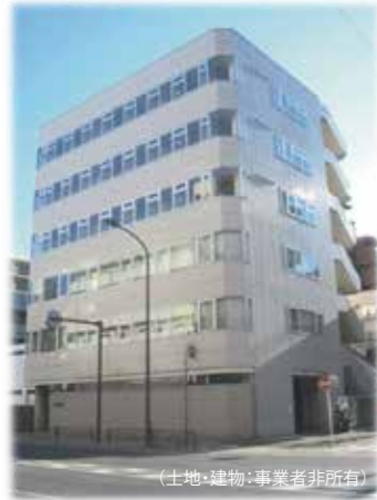
(土地・建物:事業者非所有)