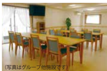
(写真はグループ他施設です)