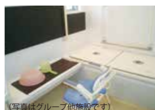
(写真はグループ他施設です)