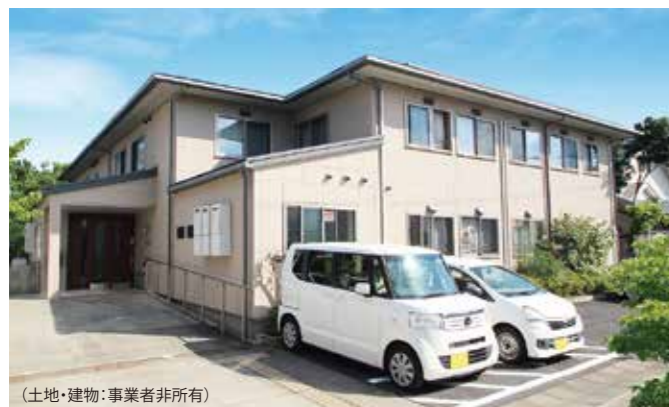
(土地・建物:事業者非所有)