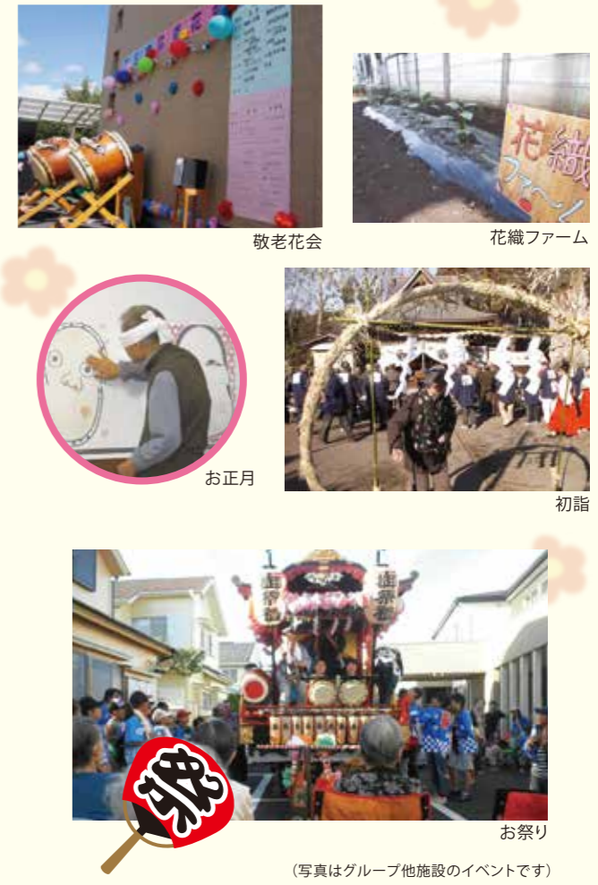
(写真はグループ他施設のイベントです)