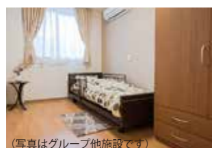
(写真はグループ他施設です)