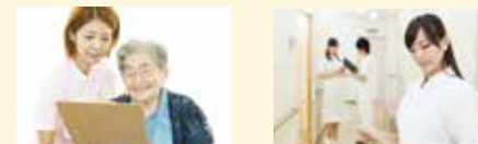
◎イベントも充実の通いサービス

専門知識と技術を持った看護師がご訪問して、医師の指示による医療処置、健康状態・病状の観察、リハビリ、療養上のお世話などをいたします。