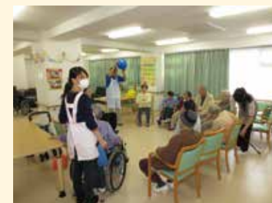
写真はグループ他施設でのご様子