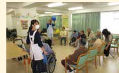
◎イベントも充実の通いサービス 写真はグループ他施設でのご様子