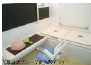
(写真はグループ他施設です)