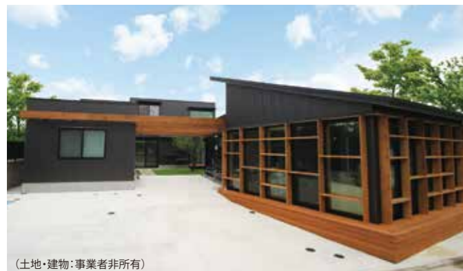
(土地・建物・事業者非所有)