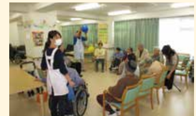
◎イベントも充実の通いサービス 写真はグループ他施設での様子