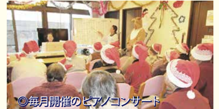
◎毎月開催のピアノコンサート

季節の行事(例:お花見、夏祭り、クリスマス会等)や、お誕生日会等、趣向を凝らした催しを行っています。