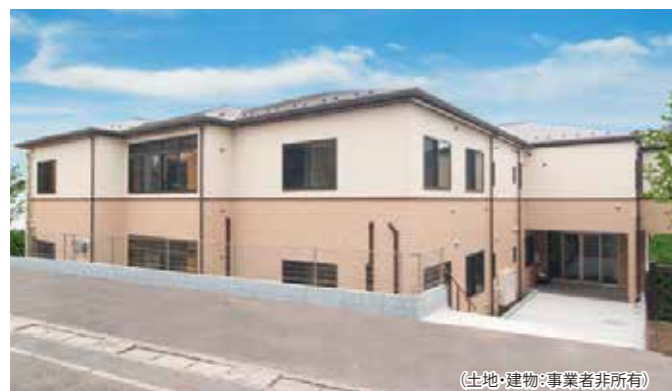
(土地・建物・事業者非所有)