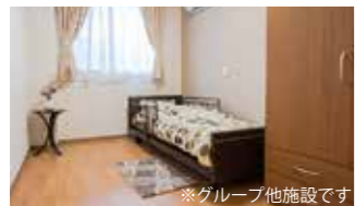
※グループ他施設です