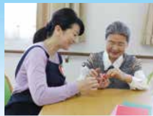
(イメージ写真です)