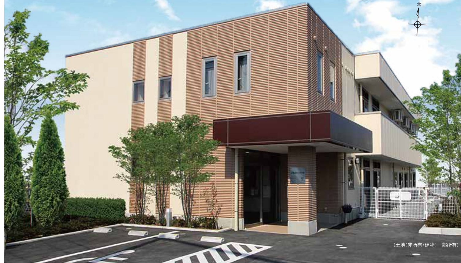
(土地:非所有・建物:一部所有)