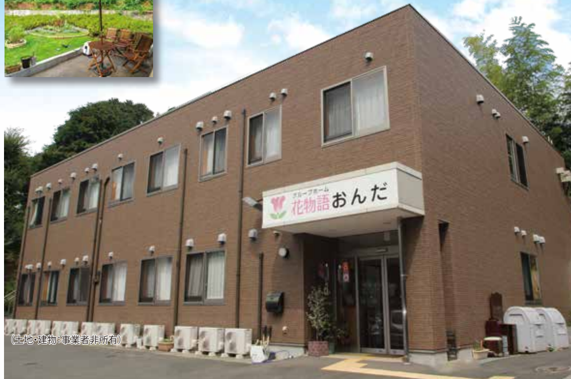
(土地・建物・事業者非所有)