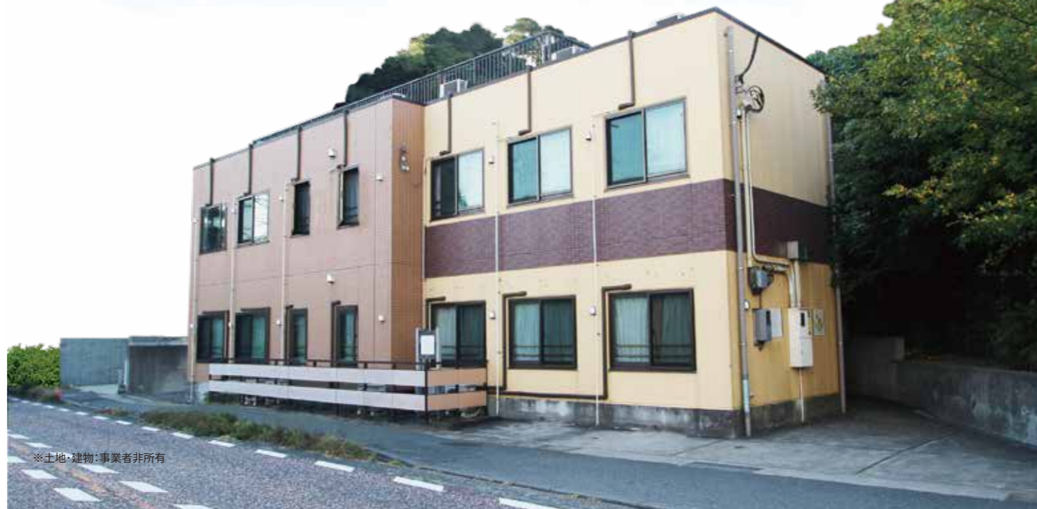
※土地・建物：事業者非所有