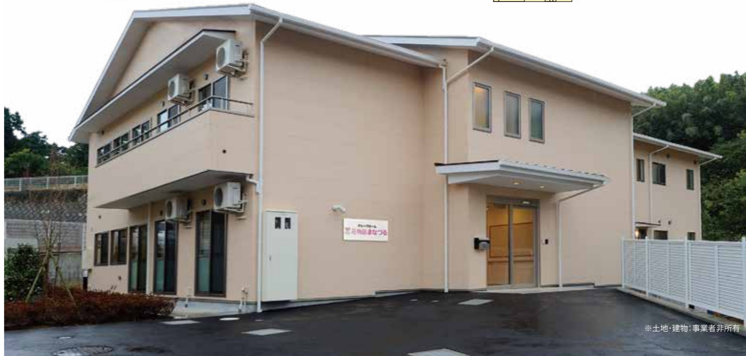
※土地・建物：事業者非所有