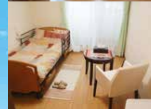
※写真はグループ他施設の設備