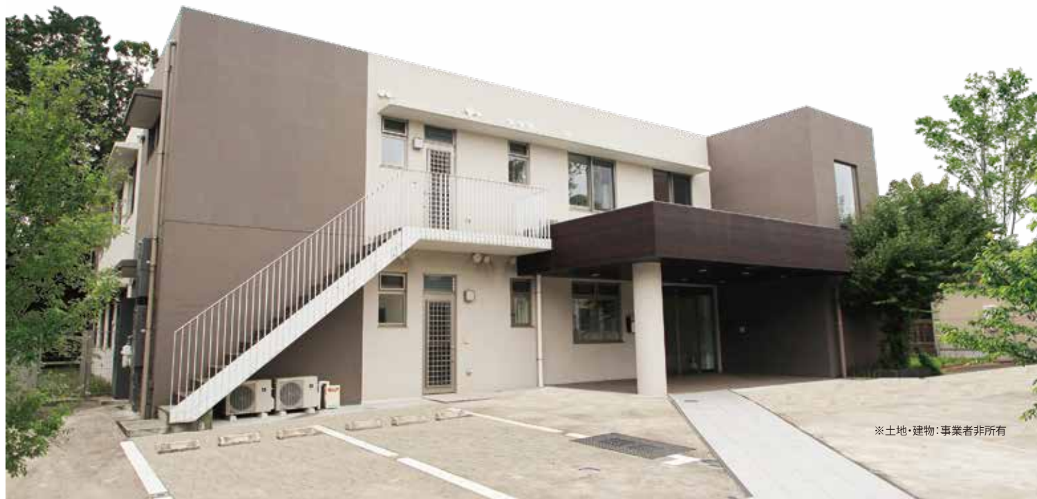
※土地・建物：事業者非所有